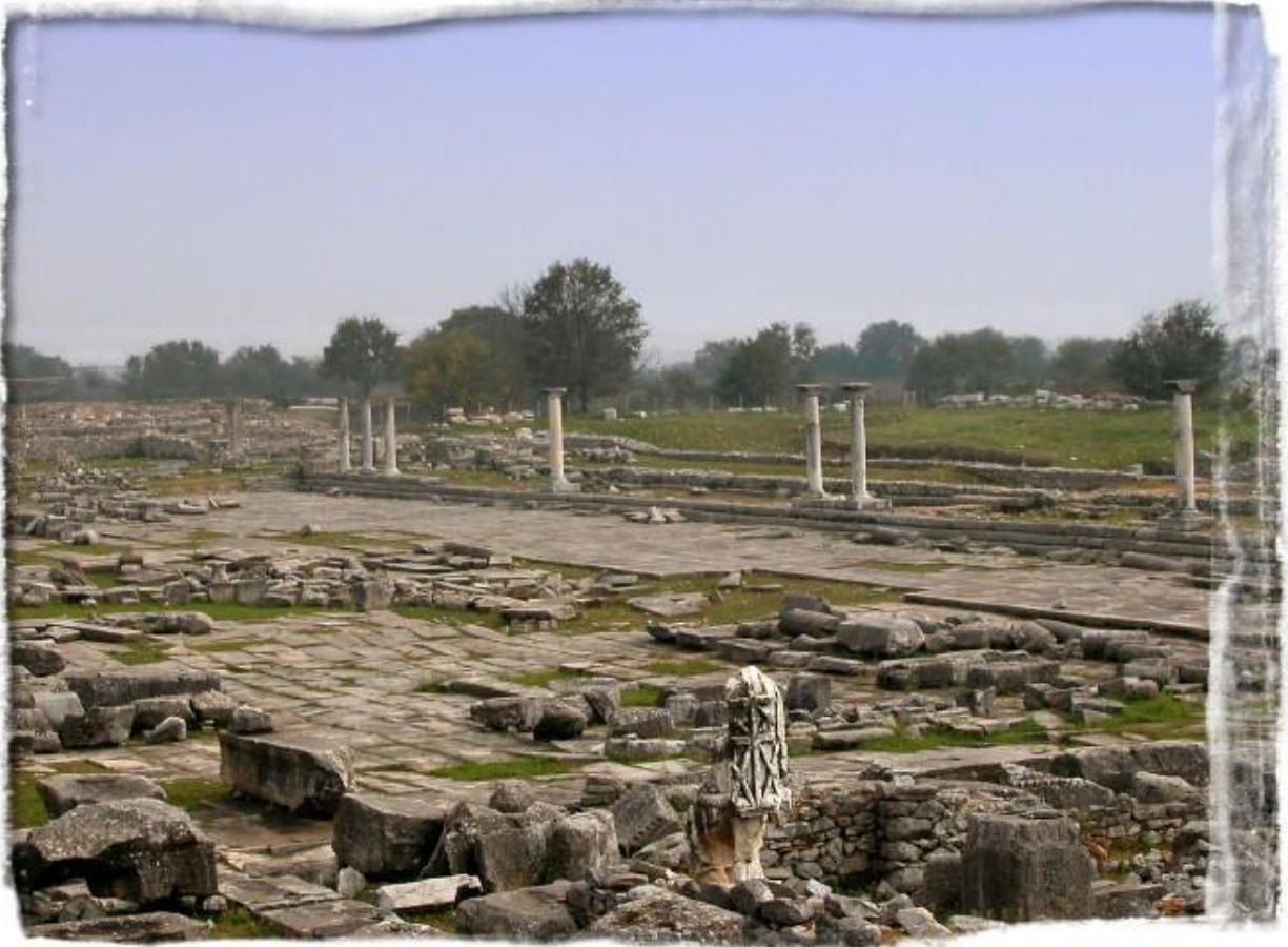
Forum romain à Philippe

"et une vision apparut à Paul dans la nuit. Un homme de Macédoine se tenait là, priant avec lui, et disant: Passez en Macédoine et aidez-nous. Et comme il avait vu la vision, aussitôt nous avons cherché à partir en Macédoine, concluant que le Seigneur nous avait appelés à les évangéliser. (actes 16:9 – 10)